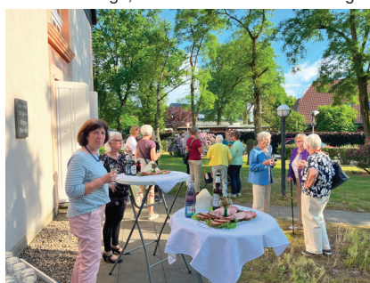
Schnitten und Klönsnack nach dem Gottesdienst